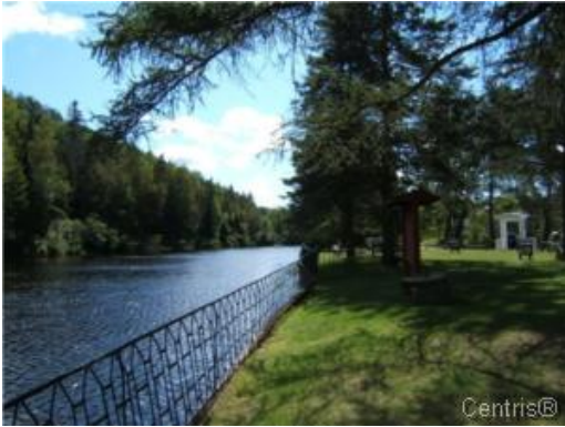
Vue sur l'eau