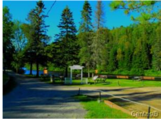
Vue sur l'eau