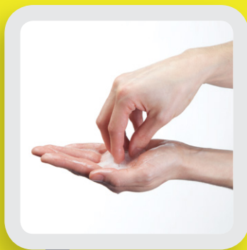
4 NETTOYER LES ONGLES