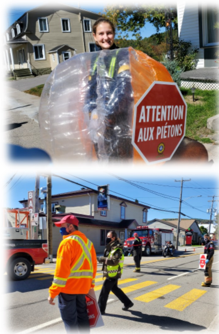
Photos prises lors de la campagne de sensibilisation du 17 septembre dernier